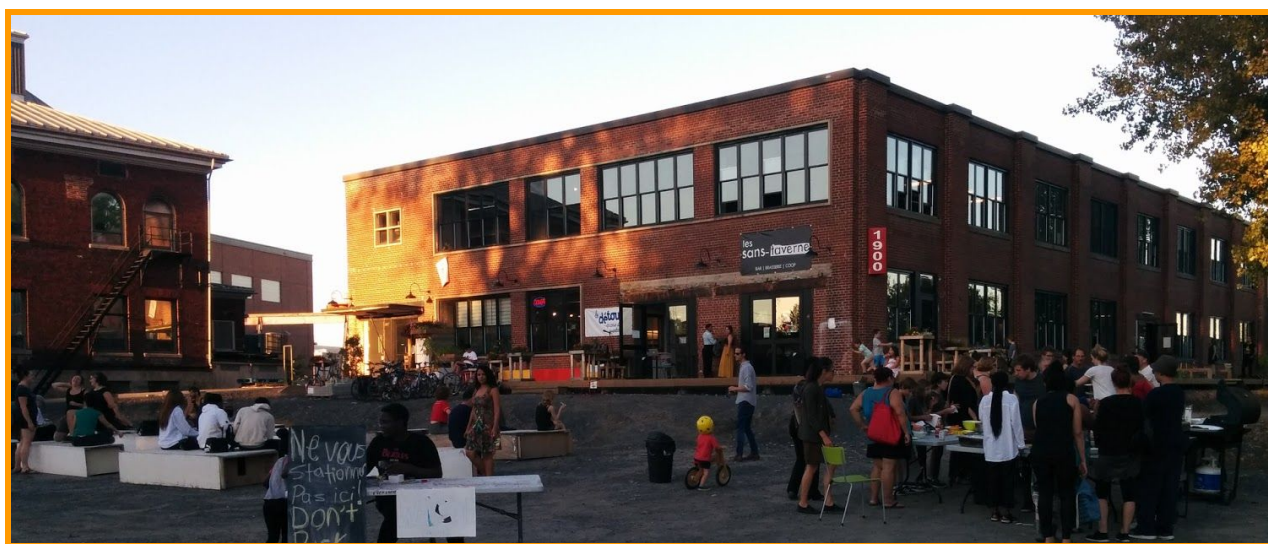
Show Hip-Hop de Press Start devant le B7 - 14 septembre 2018