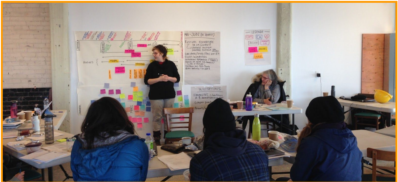
Les membres actifs du Bâtiment 7 organisent les activités d'ouverture, janvier 2018

Au début de leur occupation des lieux, les occupants ont dû s'engager via le 7 À NOUS soit par le biais d'un bail (groupes locatifs), soit par le biais d'une entente d'utilisation des ateliers (utilisateurs responsables), dont les contenus ont été travaillé et adoptés en collectif.