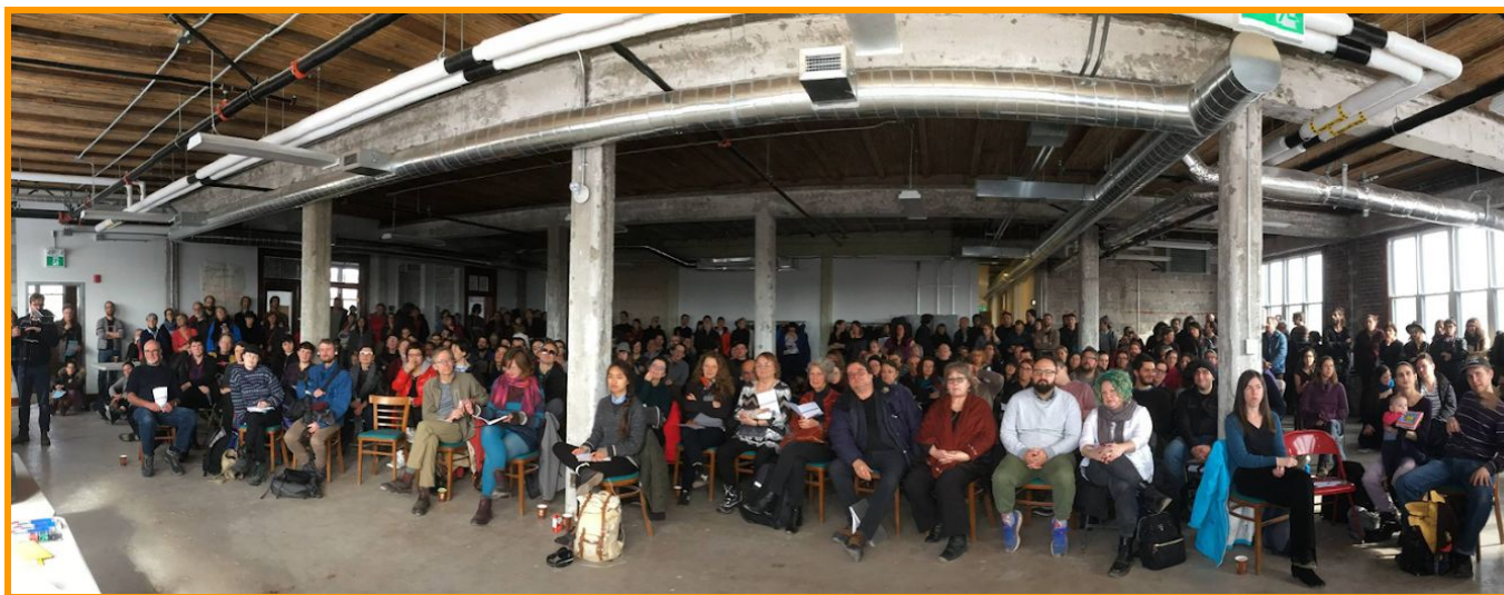
Assemblée publique au Bâtiment 7 - 24 février 2018

La mobilisation de la communauté a démarré avec une assemblée publique tenue le 24 février 2018, où environ 250 personnes se sont présentées. Ce fut la première opportunité pour la population du quartier et pour les alli.e.s du projet de visiter les lieux depuis le début du chantier de rénovation. Ce fut un moment émouvant où les membres du Bâtiment 7 pouvaient enfin partager le fruit de mois de travail avec une communauté plus large. Après un moment de présentation sur les avancées récentes du projet, les participant.e.s étaient invité.e.s à déambuler dans l'espace pour visiter les locaux des différents projets et jaser avec des membres actif·ve·s impliqué.e.s dans des aspects intangibles du Bâtiment 7 : comité démocratie, comité pôle alimentaire et conception des jardins, conception des ateliers collaboratifs, etc.