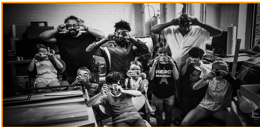
Camp de jour photo au B7 avec les jeunes de Loisirs & Culture Sud-Ouest - août 2018