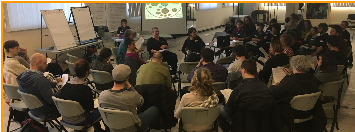
Journée de réflexion participative sur la structure démocratique (coeur élargi) - 13 février 2018