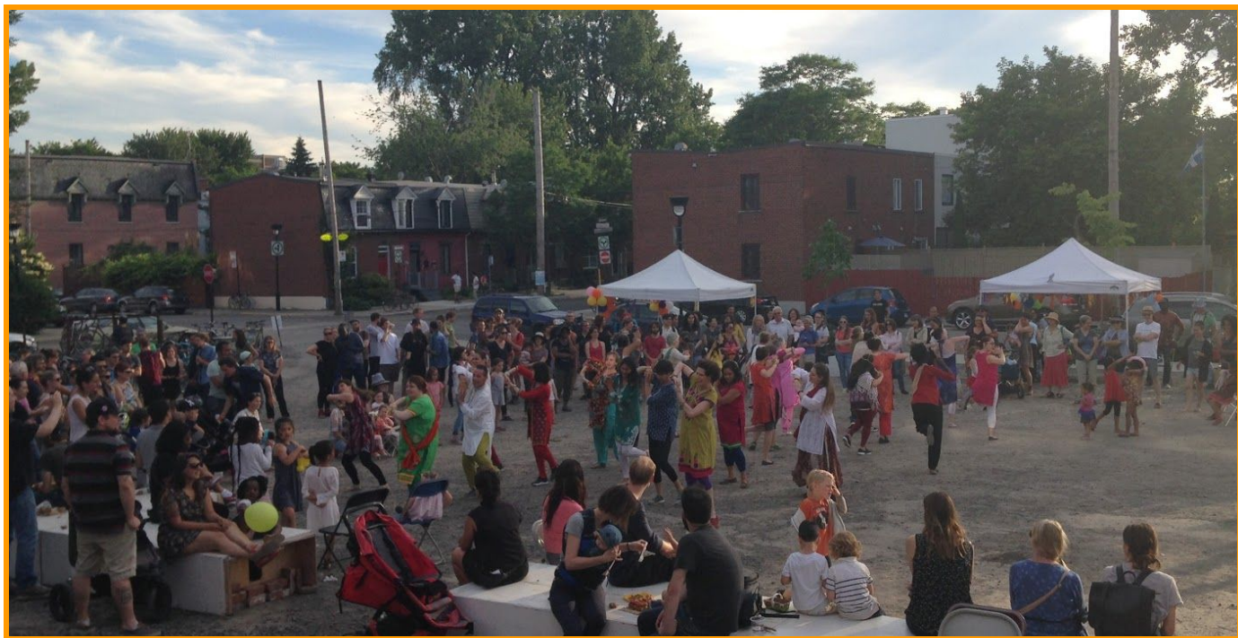
Fête de l'été au Bâtiment 7 - Troupe bollywood et line-up pour les hot-dogs - 22 juin 2018