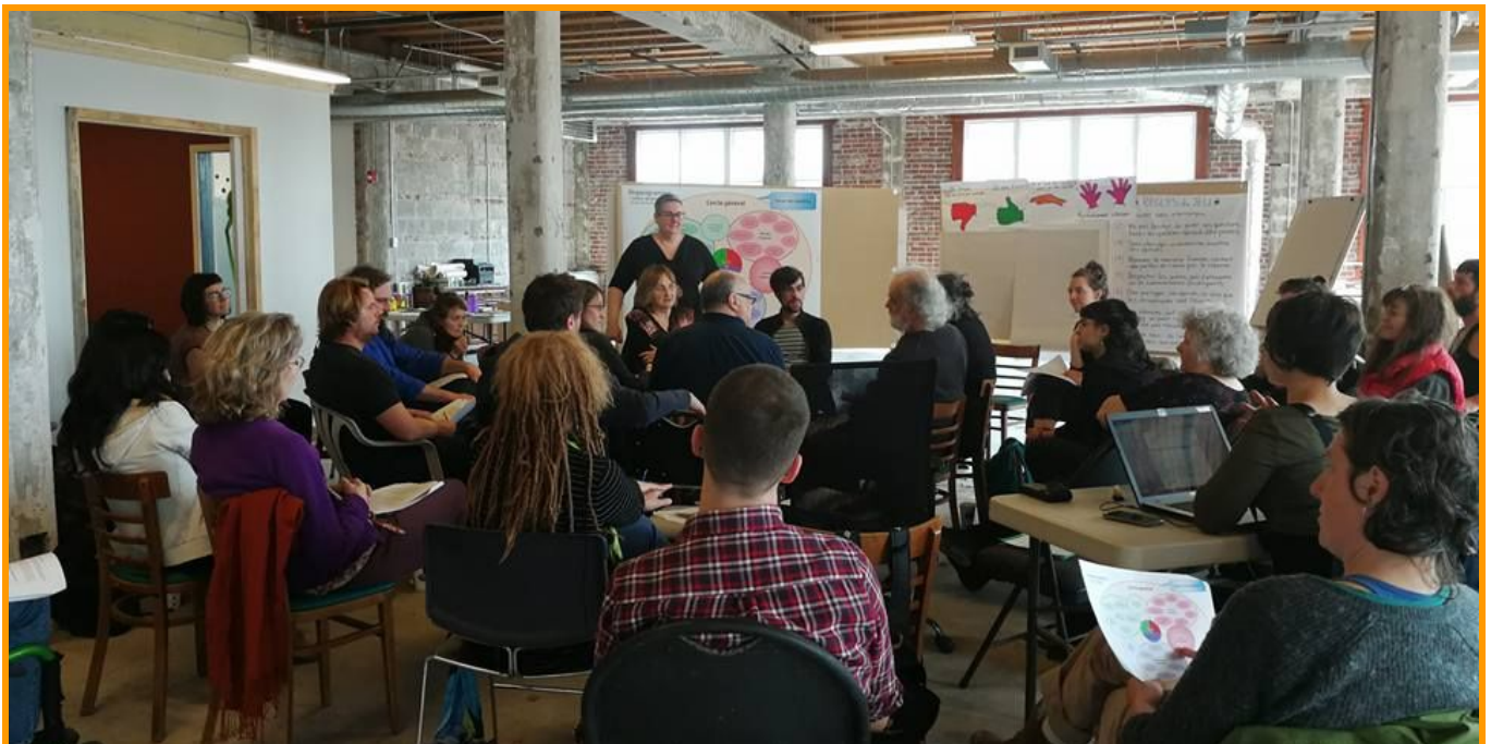
Les membres actifs qui adoptent la proposition de structure démocratique, 28 avril 2018

Une proposition de structure a été adoptée le 28 avril lors du premier cercle général, regroupant une trentaine de membres actifs. L'objectif à l'époque était de se donner jusqu'à l'automne pour la peaufiner et la préciser avec l'ensemble des membres actif-ve-s. Puis une structure améliorée et définitive aurait été adoptée lors d'un cercle général à l'automne 2018. Notre expérience de cette première année d'autogestion nous a démontré qu'il allait nous falloir plus de 6 mois pour réellement cheminer ensemble vers un modèle qui nous ressemble et nous rassemble. À la fin de 2018, nous étions encore bel et bien en transition entre l'ancien et le nouveau monde.