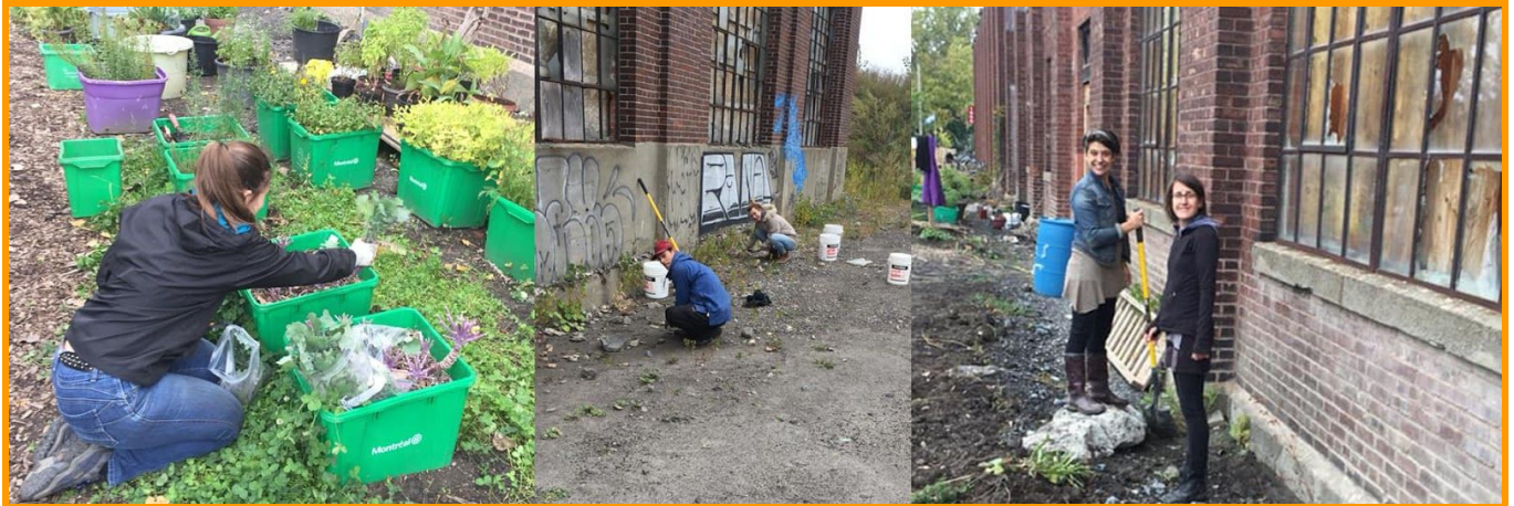
Grande corvée du terrain du B7 - 6 et 7 octobre 2018