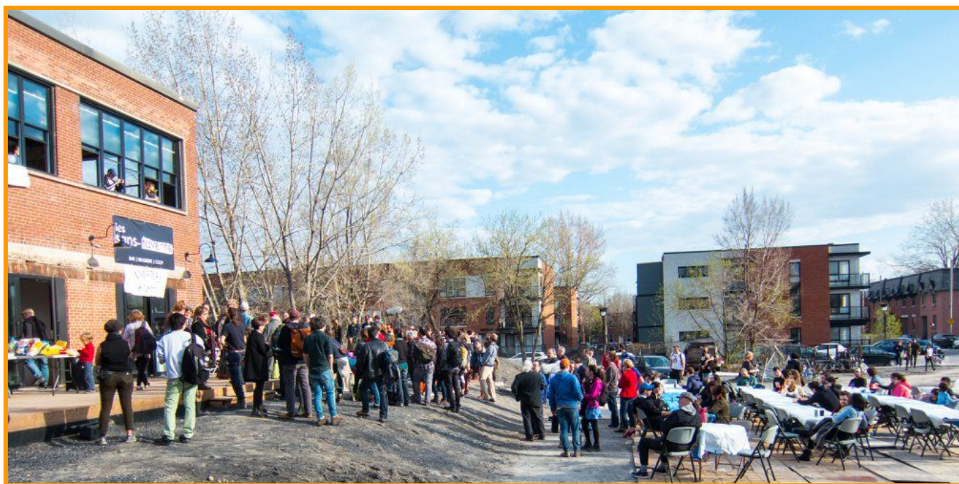
Fête d'ouverture du Bâtiment 7 le 5 mai 2018

LE moment marquant de l'année 2018 est définitivement l' ouverture au public du Bâtiment 7 , samedi le 5 mai 2018. Cette ouverture a marqué 12 printemps de mobilisation en faveur du Bâtiment 7 et 14 années de présence citoyenne pour les Terrains du CN à Pointe-Saint-Charles. Les festivités d'ouverture se sont déployées sur les mois de mai et de juin et ont attiré des centaines de personnes, en provenance de la Pointe, des quartiers environnants mais aussi d'autres villes et pays!