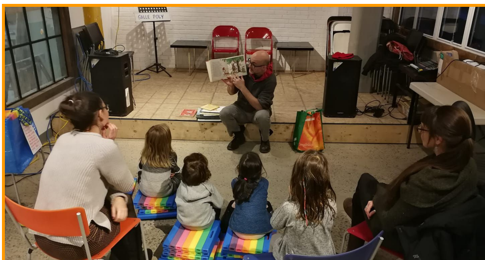
L'heure du conte au B7 - 13 novembre 2018